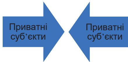
Рисунок 5.1. Горизонтальне застосування прав людини між приватними суб'єктами

Корпоративні зобов'язання отримують свою легітимність та основу внаслідок горизонтального застосування національного та міжнародного права прав людини. Традиційно лише держави були зобов'язані дотримуватися їх у відносинах із приватними суб'єктами. Держави мають позитивні зобов'язання контролювати поведінку приватних суб'єктів. 25 Однак зараз прийнято, що права людини застосовуються не лише у вертикальних, а й у горизонтальних відносинах між різними недержавними суб'єктами. 26 Крім того, тут можна погодитися з Аойфом Ноланом, який стверджує, що "горизонтальність не обов'язково несумісна з презумпціями, що лежать в основі ліберальної конституційної теорії." 27 Ліберальні демократії отримують свою легітимність із верховенства права, що, серед іншого , вимагає поваги прав людини, не лише від державних органів влади або суб'єктів, що мають зв'язок із державою, а й від приватних суб'єктів. Отже, горизонтальне застосування права прав людини ґрунтується на компонентах верховенства права, легітимність якого походить від людей. Проте навіть якщо право прав людини має горизонтальний характер, воно забезпечується державними апаратами (див. Рисунок 5.1).