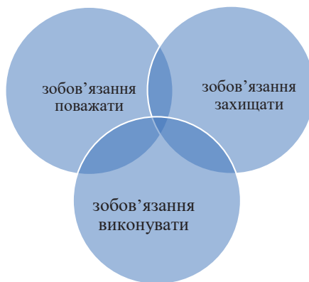
Рисунок 5.3 Тристоронні зобов'язання корпорацій щодо соціально-економічних прав (Джерело: власна праця автора)

Корпоративні зобов'язання у сфері соціально-економічних прав, по-перше, можуть бути описані в рамках негативної та позитивної дихотомії. Крім цього, їх часто пояснюють через тристоронній підхід до зобов'язань поважати, захищати та виконувати соціально-економічні права (див. Рисунок 5.3). 88 Негативні зобов'язання корпорацій зобов'язують їх поважати соціально-економічні права та уникати прямого втручання в них, тоді як позитивні зобов'язання включають зобов'язання захищати та виконувати розумне мінімальне ядро соціально-економічних прав. 89 Тристоронній підхід є найбільш доцільним для опису та аналізу сутності й обсягу корпоративних зобов'язань у сфері соціально-економічних прав, оскільки він охоплює всі виміри корпоративної поведінки та операцій, починаючи від власних ділових операцій, включаючи відносини співробітників, до їх відносин із постачальниками, підрядниками, дистриб'юторами та ширшим співтовариством. Він охоплює як позитивні, так і негативні зобов'язання, а також зобов'язання щодо результату та поведінки.